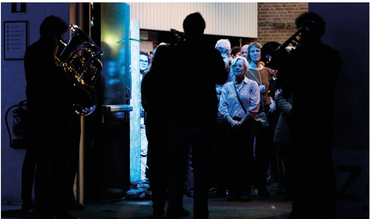
2023 #Crossover project "waar zijn" in ZIMIHC Stefanus Theater Utrecht

Met het bedrag dat wij van u vragen zijn we in staat jaarlijks drie projecten te bieden die verbindend, verhalend en van hoge muzikale en artistieke kwaliteit zijn. We dragen hiermee bij aan een pluriform cultureel veld waar verhalen te beleven en ontdekken zijn voor zeer verschillende publieksgroepen. We bieden verschillende groepen tegelijk een eigentijdse en vertrouwde plek waar ruimte is voor ontmoeting en verrijking. Deze kwaliteit kunnen wij alleen leveren met voldoende middelen om ons zelf muzikaal artistiek en ook zakelijk te ontwikkelen en te laten ondersteunen. Onze vereniging is uniek in zijn soort, springlevend door ons vernieuwende concept in combinatie met onze trouw aan de verenigingswaarden. We presteren professioneel, maar we zijn nog steeds vrijwilligers die met energie en enthousiasme een breed publiek kunnen aanspreken.